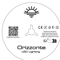
5 Meter pro Rolle