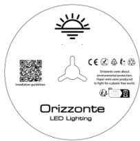
5 Meter pro Rolle