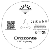
5 Meter pro Rolle