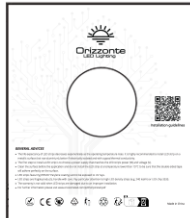
1 Rolle pro Umschlag

Orizzonte Benutzer Papierboxen LED Streifen kämpfen für eine plastikfreie Welt.