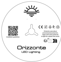
5 Meter pro Rolle