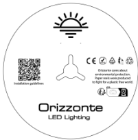
5 Meter pro Rolle