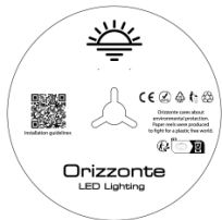
5 Meter pro Rolle