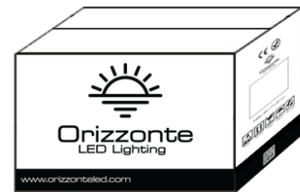
250 Meter pro Karton