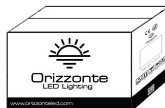
250 Meter pro Karton