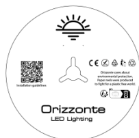
5 Meter pro Rolle