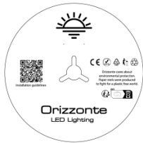
5 Meter pro Rolle