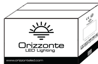
250 Meter pro Karton