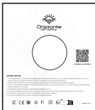
1 Rolle pro Umschlag

Orizzonte Benutzer Papierboxen LED Streifen kämpfen für eine plastikfreie Welt.