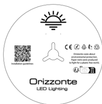
5 Meter pro Rolle